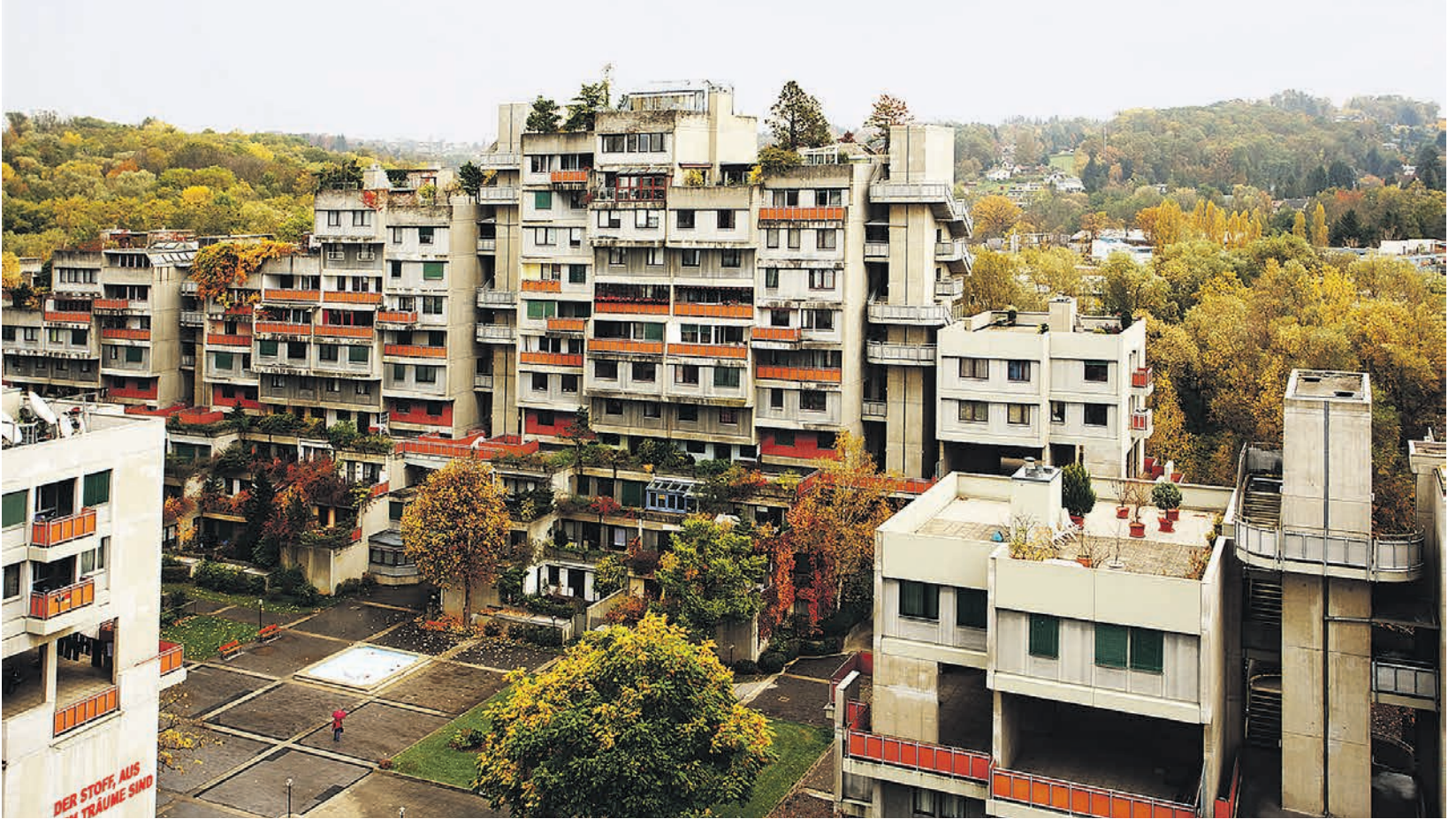
Die Terrassenhaussiedlung, hier einer der Blöcke, ist ein Monolith des Städtebaus – Planung und Bauzeit nahmen viele Jahre in Anspruch