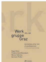
Werkgruppe Graz. Architecture at the Turn of Late Modernism.